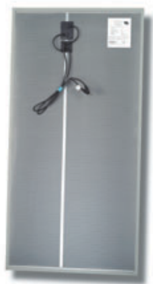
Solarmodul der Serie FS