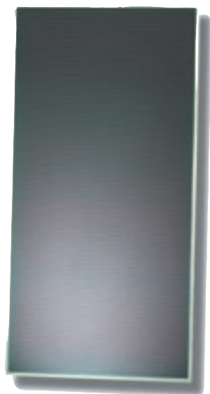
Solar modul der Serie FS