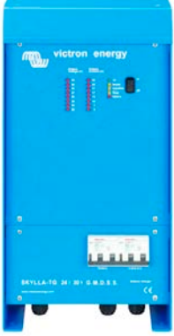
Skylla TG 24 30 GMDSS